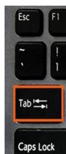
Figura 1 - Tecla [TAB] no teclado que faz o “Recuo de Parágrafo” na primeira linha a cada início de parágrafo